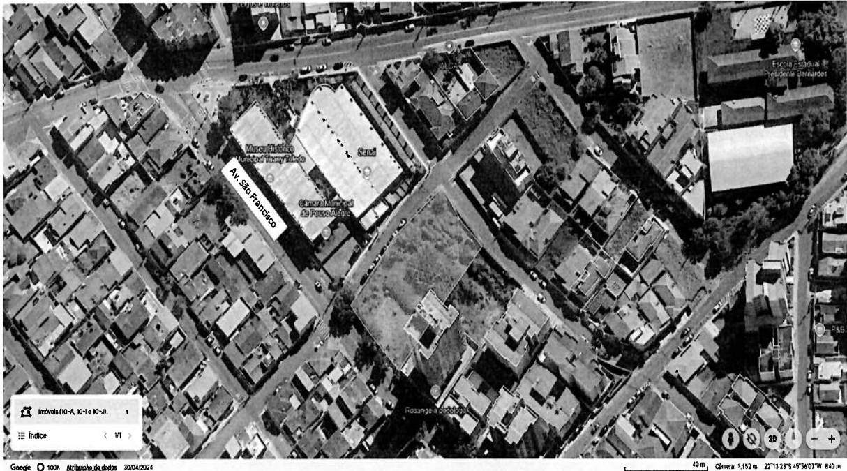
Figura 01 – Lotes a serem avaliados.